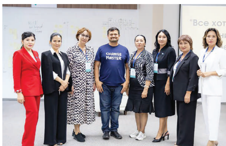
Елордада әйелдер саяси көшбасшылығын ілгерілетуге бағытталған Tomiris жобасына қатысушыларды қарқынды оқыту курсы аяқталды.

Айта кетейік, биыл аталған іс-шараға «Атырау облысы Іскер әйелдер қауымдастығы» қоғамдық бірлестігі де атсалысып жатыр.